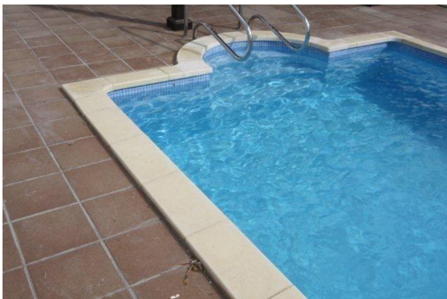
6. Fyldt bassin