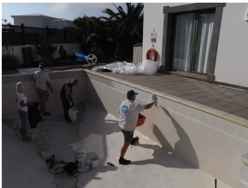
1. PolyFlex SC ® fåføres bassin-overfladen

Løsning hvor PolyFlex SC ® er den primære tætning. Bord af fliser sættes i bassinets øverste del. I den nederste del påføres Top-Coat med indfarvet tilslag.